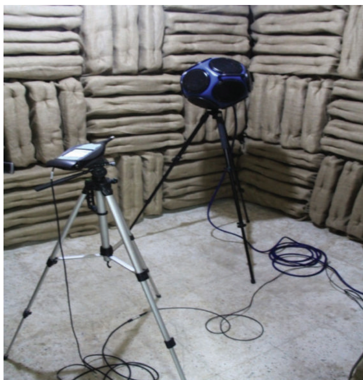
شکل ۱: ست اندازه‌گیری زمان بازآوایی به روش صدای منقطع

قبل از کار با نرم افزار زمان بازآوایی مورد هدف، سطح جذب مورد هدف و سطح کلی مورد هدف در فرکانس معین شده به منظور طراحی با نرم افزار، تعیین گردید.